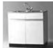
38051 Mietspüle (Abbildung ähnlich)