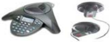
37006 Konferenztelefon mit zus. Mikrofon