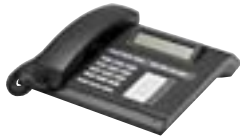
37002 IP Telefon